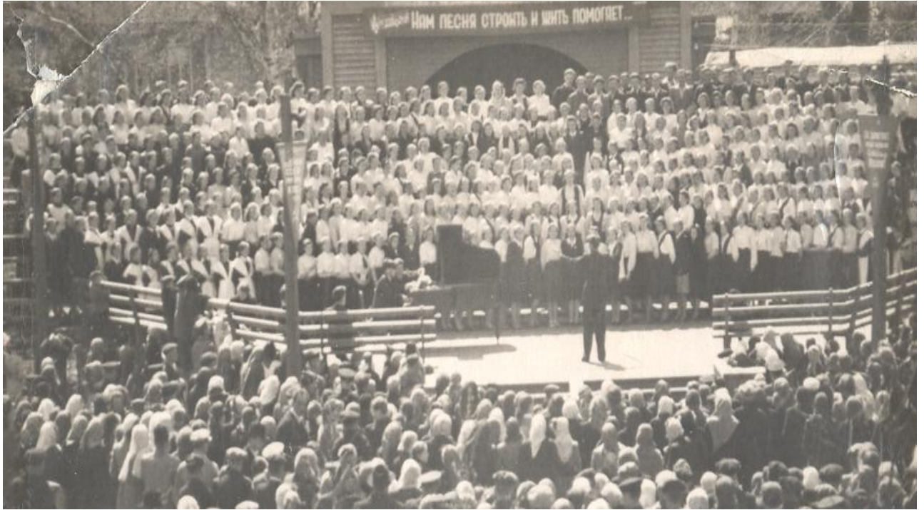
Сводный хор трудовых коллективов, учащихся школ, студентов педагогического института и училища г. Енисейск, 1969 г.