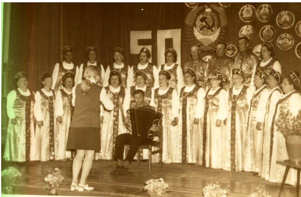
Городской дом культуры г. Енисейска, декабрь 1972 г. Выступление самодеятельного коллектива Енисейской сплавной конторы на праздничном концерте «15 республик – 15 сестер».