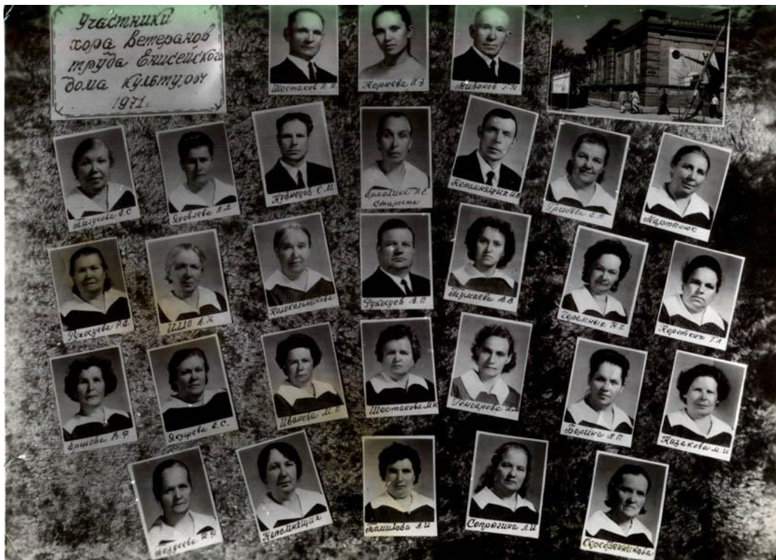
Участники хора ветеранов труда Енисейского дома культуры, 1971 г. Участники Всесоюзного смотра в г. Москве, 1975 г.