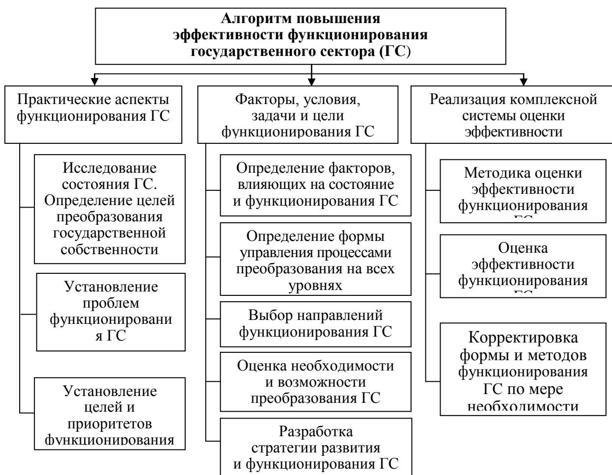
Рисунок 2 – Алгоритм повышения эффективности функционирования государственного сектора

В рамках диссертационного исследования был разработан алгоритм повышения эффективности функционирования государственного сектора (рис. 2) и предложены направления повышения эффективности его функционирования для поддержания экономического роста национальной экономики.