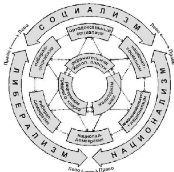
Рис 1. Схема взаимодействия классических видов политических идеологий

Среднюю окружность образуют собственно идеологии, имеющие специфическую окраску и не носящие универсального характера. В них принято выделять «правое» и «левое» крыло, через которое осуществляется связь с соседними политическими доктринами.